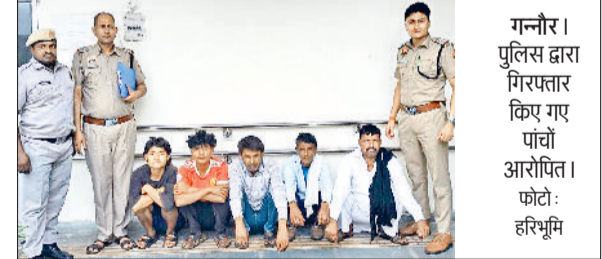
गन्नौर। पुलिस द्वारा गिरफ्तार किए गए पांच आरोपित।

लगी। जिस पर लोगों ने आपत्ति जताई है। अब स्थानीय लोगों ने लापरवाह अधिकारियों के खिलाफ सख्त कार्रवाई करते हुए नए सिरे से नाली का निर्माण करवाने की मांग की है।