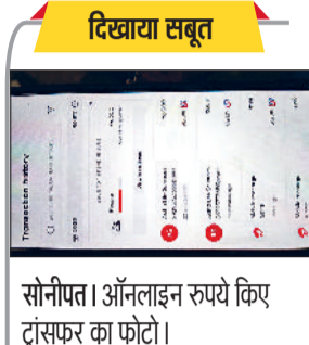
सोनीपत। ऑनलाइन रुपये किए ट्रांसफर का फोटो।