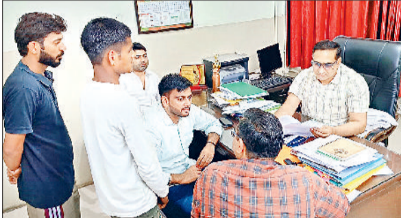
सोनीपत। प्रबंधन को शिकायत देते हुए पीड़ित युवक।

बता दें कि नागरिक अस्पताल के प्रथम तल पर कमरा नंबर-120 में अस्पताल में जन्म लेने वाले बच्चों व पोस्टमार्टम होने के बाद मृतक का मृत्यु प्रमाण-पत्र जारी किया जाता है। गत दिनों से साइट में दिक्कत होने