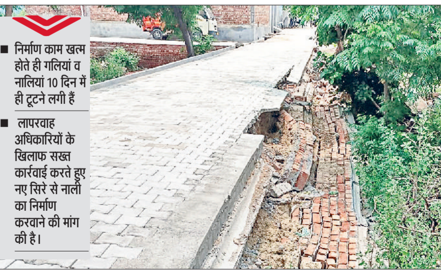
गन्नौर। नगरपालिका द्वारा बनवाई हुई पहली ही बरसात में टूटी हुई गलियों की नालियां।

नगरपालिका के कारनामे लगातार सामने आ रहे हैं। जहां टेकेदार द्वारा निर्माण काम खत्म होते ही गलियां व नालियां 10 दिन में ही टूट रही हैं। नगरपालिका के अधिकारियों की अनदेखी भारी पड़ रही है। नया अधिकारी शहर में लगातार विकास के दावे कर रहे हैं, लेकिन गलियों में घटिया सामग्री से निर्माण किया जा रहा है। खेड़ी रोड पर नगरपालिका द्वारा गलियों व नालियों का निर्माण किया जा रहा है। जिसमें टेकेदार घटिया निर्माण सामग्री का इस्तेमाल कर रहा है। जिस वजह से 10 दिन के अंदर नालियां टूटने लगी हैं। वहीं पहली बारिश में नपा के विकास के दावे फेल हो गए। जब बारिश में पानी नालियां में भरा तो नालियों की बनी दीवार टूटने लगी। स्थानीय निवासी रोहतास, सतपाल, ईश्वर व विजय ने बताया कि उनकी गली में टेकेदार घटिया सामग्री इस्तेमाल कर निर्माण