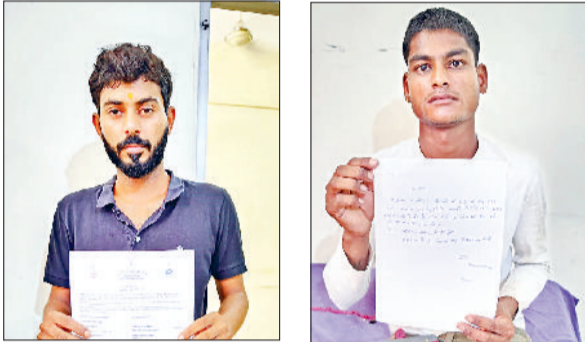
सोनीपत। शिकायत दिखाते हुए दोनों शिकायतकर्ता।