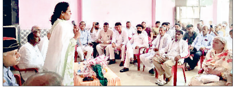
खरखौदा। कार्यकर्ताओं को संबोधित करते सांसद वर्षा गायकवाड़।

एआईसीसी ऑब्जर्वर एवं सांसद वर्षा गायकवाड़ बुधवार को खरखौदा के वाल्मीकि आश्रम में पहुंची और संगठनात्मक मुद्दे पर पार्टी कार्यकर्ताओं के विचार जाने। कार्यकर्ताओं से मुखातिब होते हुए उन्होंने कहा कि पार्टी के संगठन को मजबूत बनाने के लिए प्रत्येक कार्यकर्ता को अपने मजबूत इरादों से मेहनत करनी चाहिए। पार्टी के प्रत्येक कार्यकर्ता को अपनी भागीदारी सुनिश्चित करने के लिए अपने क्षेत्र में पूरी लगन के साथ मेहनत करनी चाहिए।